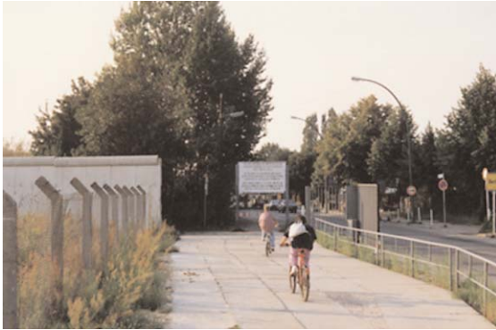
LE MUR JUSTE APRÈS L'OUVERTURE

Celui qui voulait se rendre dans l'autre partie de la ville avait besoin d'une autorisation. C'était une situation vraiment inhumaine, beaucoup d'amitiés et de liens familiaux ont été brisés par ce mur. En tant que maire, je devais tout faire pour que la division de la ville causée par ce mur devienne ou reste à peu près supportable. C'était très difficile, mais pour moi ce fut une période très importante pendant laquelle j'ai beaucoup appris.