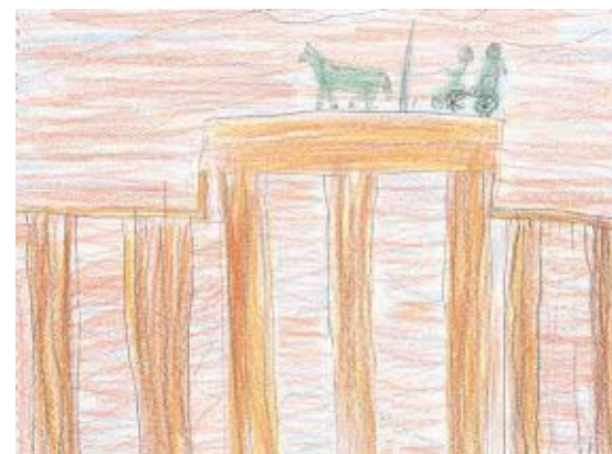
LA PORTE DE BRANDEBOURG À BERLIN

Le Chancelier fédéral allemand est le chef du gouvernement. Lui et son gouvernement peuvent prendre des mesures gouvernementales sans consulter le Président, mais le Chancelier ne peut pas promulguer les lois. Il faut que le Président les signe d'abord. Dans la politique gouvernementale, le Chancelier occupe une position nettement plus forte que le Président.