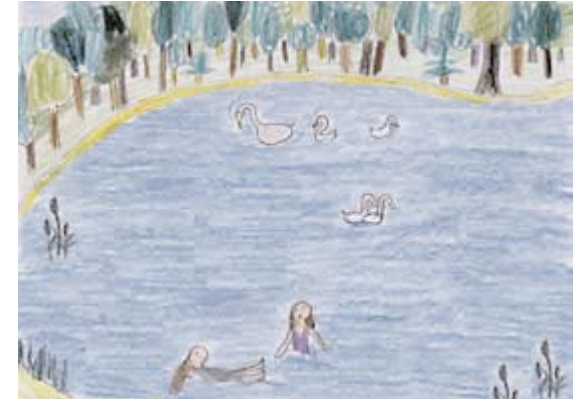
JE VAIS PARFOIS AU LAC DE SCHLACHTENSEE...

Oui. Je vais parfois au lac de Schlachtensee. Y êtes-vous déjà allés ?