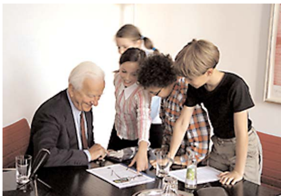
NOUS MONTRONS NOTRE JOURNAL GRAND MÉCHANT LOUP

Le Grand méchant loup a rencontré Richard von Weizsäcker, qui a été Président de l'Allemagne de 1984 à 1994. A l'époque, nous n'étions pas encore nés. Pourtant, nous nous sommes très bien entendus avec lui et nous avons non seulement appris qu'être Président en France ou en Allemagne, ce n'était pas la même chose, mais aussi qu'il ne fallait pas être triste de ne plus l'être.