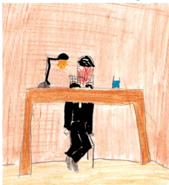
MAN MUSS VERTRÄGE PRÜFEN

Muss der Direktor der Galeries Lafayette Franzose sein? Nicht zwingend, ich glaube nicht.