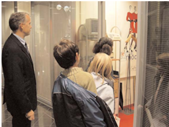
EIN KURZER BLICK IN DIE BÜROS