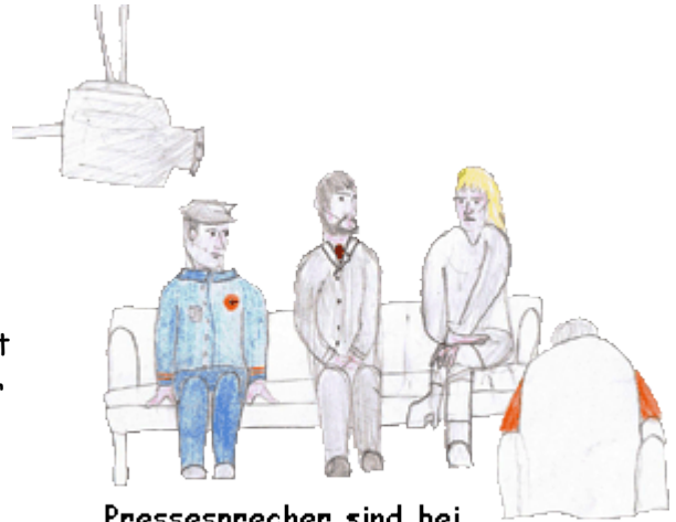
Pressesprecher sind bei Interviews immer dabei

Man muss ein abgeschlossenes Hochschulstudium haben und man sollte auch praktische Berufserfahrung als Journalist haben. Unsere Kunden sind ja die Journalisten. Da sind wir gut beraten, wenn wir wissen, wie sie arbeiten, was sie brauchen, was sie interessiert. Wir müssen auch oft intern recherchieren. Ich bin selbst kein Pilot, aber dadurch, dass ich öfter zu Gast im Cockpit war, oder durch den Kontakt zu den Piloten und Pilotinnen habe ich mir im Laufe der Zeit einiges angeeignet.