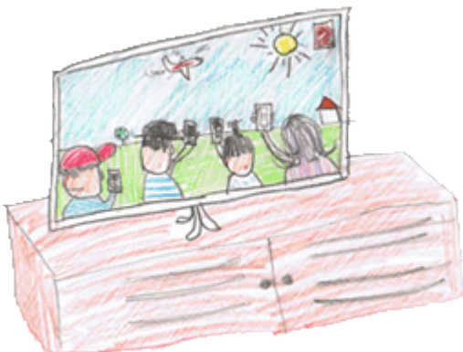
Das Video hat ein Spotter am Flughafenzaun gedreht

Ja, den gibt es. Manchmal verläuft der dann ganz anders. Das ist ja das Spannende. So gegen 9 Uhr finden wir uns in Frankfurt, in Flughafennähe ein. Dann druckt man die Presseschau aus. Um 9:30 werktags gibt es eine kleine Schaltkonferenz mit anderen Pressesprechern. Dann berichtet der Kollege oder die Kollegin, die Rufbereitschaft hat, was in der Nacht zuvor möglicherweise passiert ist. Dann geht man so reihum. Was ist an Arbeitsergebnissen zu finden? Was ist in der Presseschau? Man erwähnt etwa, dass nun das in der vergangenen Woche geführte Interview erschienen ist. Oder es ist zu erfahren, dass um 13 Uhr die monatlichen Verkehrszahlen erscheinen und die ARD über neue Flugrouten in Frankfurt berichten will.